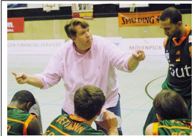
Der Dirigent gibt den Takt vor!

Ich war größer als alle anderen und jemand meinte, ich soll einen Mannschaftssport machen. Dann habe ich mit 11 oder 12 angefangen.