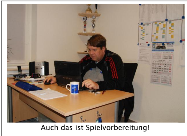
Auch das ist Spielvorbereitung!

Eigentlich gehört ein Trainer in die Halle – was soll er auch sonst machen? Doch in allen modernen Sportarten sind Trainer mehr als die althergebrachten Übungsleiter, die mit einer Trillerpfeife am Spielfeldrand stehen und Anweisungen an die trainierende Mannschaft bellen. Neben der technischen und konditionellen Arbeit ist vor allem die strategisch taktische Vorbereitung auf ein Spiel oftmals mit-